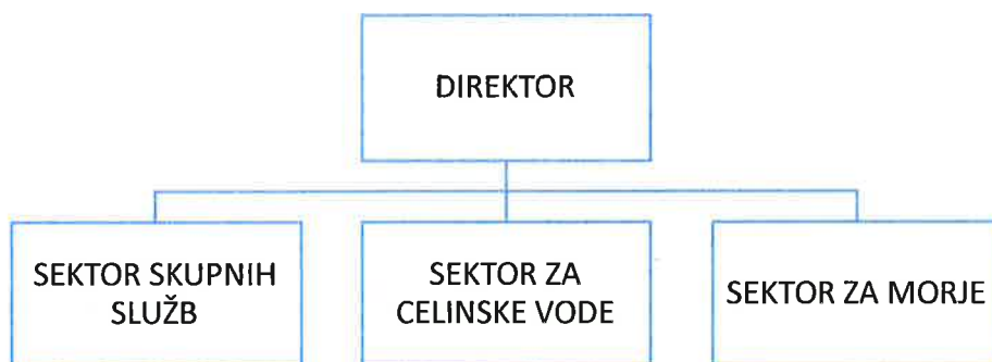
Slika 1: Organigram Inštituta za vode republike Slovenije

Za izvajanje registriranih dejavnosti je inštitut po veljavnem statutu organiziran v organizacijske enote: